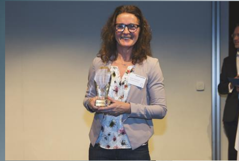
Honorary Award For Extraordinary Contributions to Antura Group 2016: Husqvarna