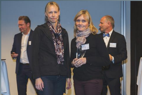
Best Implementation Award Public Sector 2016: Svenska kraftnät