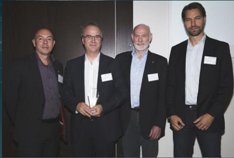
Best Implementation Award Private Sector 2016: Saab Aeronautics